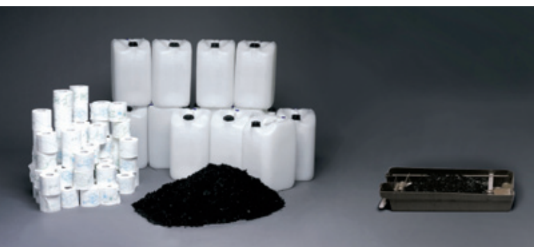
Mullen som du tömmer ut från MullToa är endast 5-10 procent av ursprungsvolymen. Bilden visar hur mycket toaletten kan hantera innan du behöver tömma lådan första gången. Fantastiskt, eller hur?

Det är enkelt att installera en MullToa med hjälp av de tydliga installationsanvisningarna som följer med. De vanligaste frågorna ser du under Frågor & svar på detta uppslag.